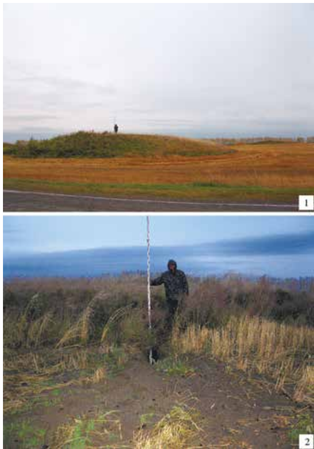
Рис. 2. Фотографии курганного могильника Ивановка-1 (2009 г.): 1 – курганы №1 и 2 (снято с севера); 2 – нора животного на кургане №1

пей курганов), являются условными, так как вероятность наличия уже полностью распаханных курганов очень высока. Данное обстоятельство касается большинства расположенных на пахотных полях курганных могильников в лесостепной и степной зоне Алтайского края.