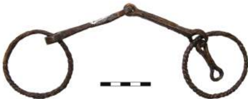
Рис. 4. Кок-Паш. Удила с псалиями из кургана № 1

Одной из довольно редких находок являются удила с кольчатыми ложновитыми псалиями , обнаруженные под насыпью кургана №1 (см. рис. 3, 1; 4). Отдельные аспекты исследования изделий такого типа уже представлялись в публикациях одного из авторов настоящей статьи (Тишкин, Серегин 2011: 17–18; Серегин 2018: 178–179). Дискуссионность датировки кольчатых ложновитых псалиев, в рамках сложившейся историографической традиции относимых большинством исследователей к последним векам I тыс. н.э. (Кызласов 1969: 114; Савинов 1984: 134; Овчинникова 1990: 98–99; Кубарев 2005: 140), определяет необходимость подготовки отдельной работы с подробным обоснованием особенностей распространения предметов. В настоящей статье лишь кратко остановимся на возможностях определения хронологии подобных находок.