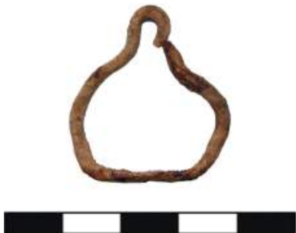
Рис. 5. Кок-Паш. Миниатюрное стремя из кургана № 1

Датировка этих комплексов, принимая во внимание дискуссионность хронологии склепов Минусинской котловины, может быть определена в широких рамках V–VI вв. Кроме того, одно миниатюрное стремя происходит из тюркской оградки из урочища Мейшелык на Алтае (Савинов 2005, рис. 2, 5). По мнению Д.Г. Савинова (2005: 134), зафиксированные в ходе раскопок находки, в том числе стремя, связаны с более поздним (впускным?) погребением и относятся к концу I – началу II тыс. Другие исследователи склоняются к тому, что предметы составляют с оградкой единый комплекс и датируются «таштыкским временем» (Гаврилова 1965: 34) или V–VI вв. н.э. (Кубарев 2016: 454). Таким образом, имеющиеся материалы позволяют утверждать, что вотивные стремена характерны для памятников середины I тыс. н.э.*