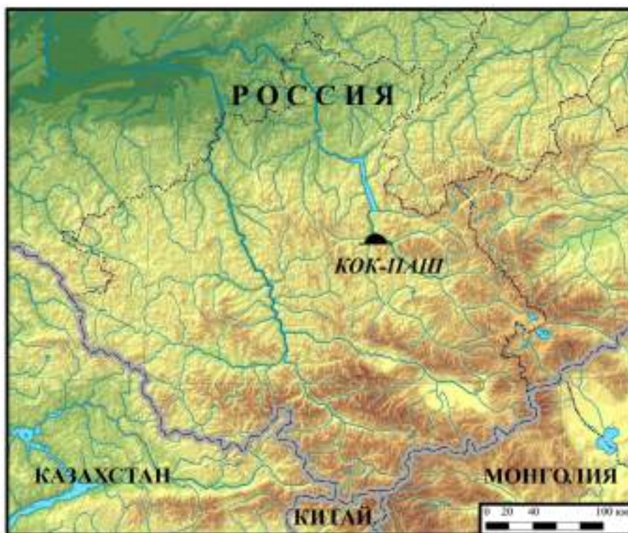
Рис. 1. Карта расположения комплекса Кок-Паш

Курганы № 1–2 расположены в нескольких метрах друг от друга в центральной части обширного могильного поля Кок-Паш, среди объектов различных хронологических периодов. Какой-либо четкой закономерности в их локализации не прослеживается. Отметим, что ранне-средневековые курганы находятся к востоку–юго-востоку от крупной насыпи скифо-сакского времени. Рядом с ними зафиксированы раскопанные погребения жужанского периода, не исследованные тюркские оградки, а также другие объекты, культурно-хронологическая принадлежность которых не установлена.