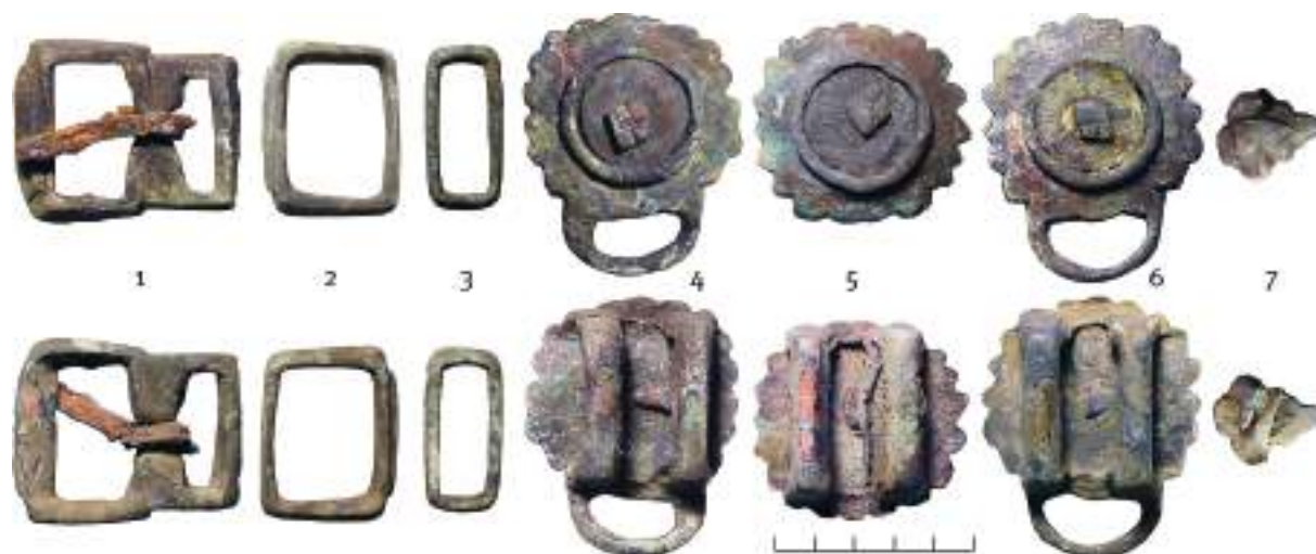
Рис. 4. Металлические детали наборного пояса (вид с двух сторон). Некрополь Проспихинская Шивера-IV, погребение № 8. 1 – пряжка; 2, 3 – тренчики; 4, 6 – бляхи-обоймы со скобой; 5 – бляха-обойма без скобы; 7 – фигурная бляха со шпеньками. 1–7 – цветной металл