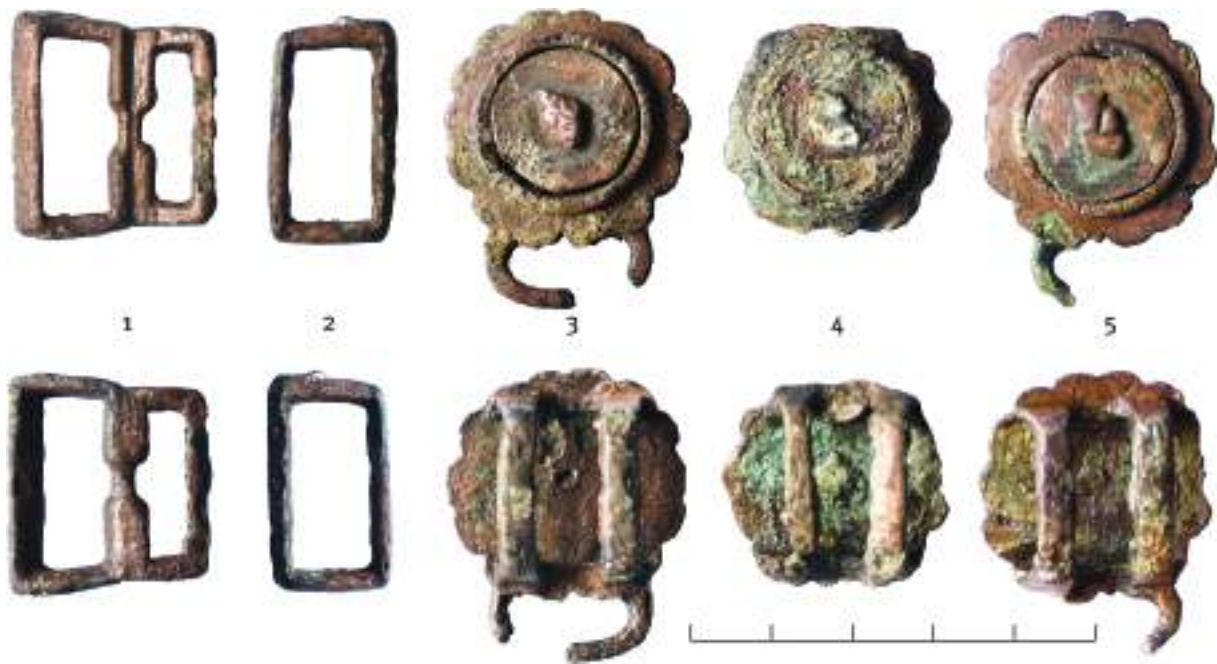
Рис. 2. Металлические детали наборного пояса (вид с двух сторон). Археологический комплекс Кармацкий, курган № 9, могила № 2. 1 – пряжка; 2 – тренчик; 3, 5 – бляхи-обоймы со скобой; 4 – бляха-обойма без скобы.