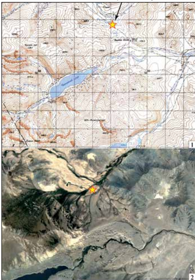
Рис. 1. Месторасположение археологического микрорайона в урочище Хурээ зуслан (Алтай сомон, Баян-Ульгийский аймак, Монголия): 1 – на фрагменте карты; 2 – на фотоснимке из космоса

К северо-западу от объекта №1 находится цепочка курганов, ориентированная примерно по линии ЮЗ–СВ. Нумерация курганов дана с учетом уже сделанного обозначения. Описание приводится в более детальном виде, чем для других сооружений, зафиксированных на рассматриваемом памятнике, что связано с лучшей сохранностью.