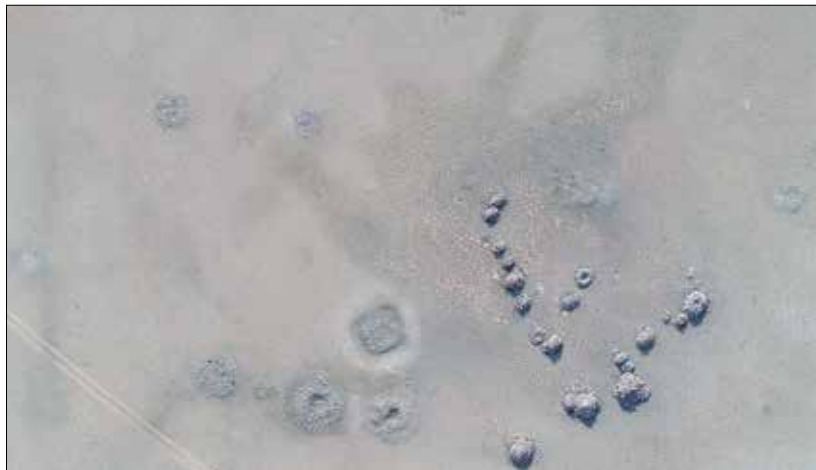
Рис. 3. Хурээ зуслан-I. Вид на археологические объекты

Объект №2а находится в 1,5–2 м к юго-востоку от кургана №2 и представляет собой выкладку подовальной формы размерами 3,0×2,8 м. Определить назначение сооружения проблематично. Часть камней к северо-западу (между курганом и выкладкой) лежит беспорядочно. В центре их почти нет. Неровное кольцо вытянуто по линии ЮВ–СЗ. Высота выделяющихся камней выкладки зафиксирована на отметке 0,15 м, остальные ниже (в основном 0,1 м).