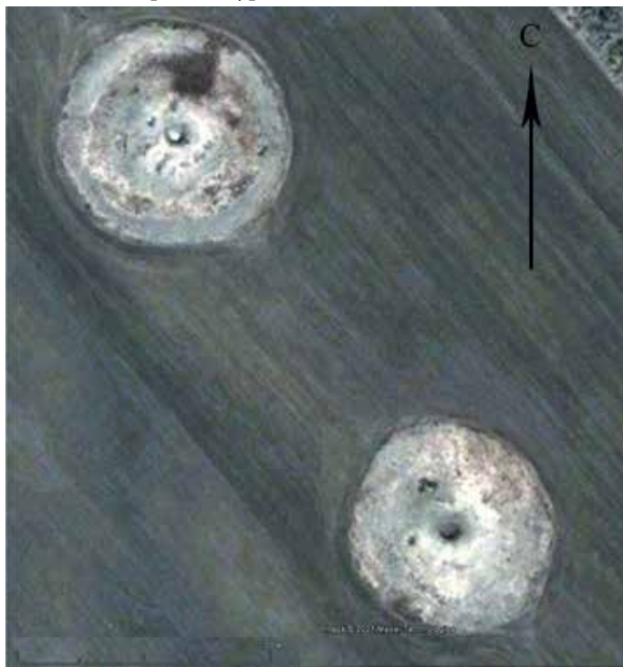
Рис. 2. Космоснимок курганов №1 и 2 курганного могильника Пятков Лог-I

диаметром 10–12 м, окруженные мощным кольцевым грабительским отвалом. По кругу в насыпях имеется еще несколько грабительских ям. К северо-западу и к западу от курганов №1 и 2 располагается обширное курганное поле, насчитывающее более 50 распаханых курганных насыпей диаметром 12–20 м. Другие нераспаханные насыпи могильника, входящие в центральную цепочку, также имеют значительные размеры: курган №3 – диаметр 36 м, курган №4 – 40 м, №5 – 45 м, №6 – 32 м.