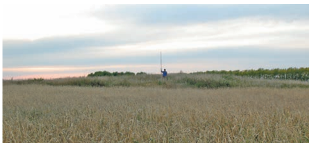
Рис. 2. Курганный могильник Андроново-I (Андроново-5), 2009 г.