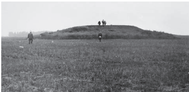
Рис. 1. Курганный могильник Андроново-I (Андроново-5), 1974 г.;